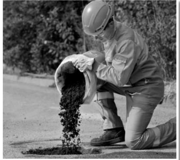
Hình B.2 – Rải hỗn hợp bê tông nhựa nguội vào hố / ổ gà cần vá