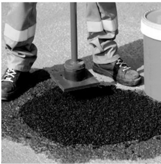
Hình B.6a – Đầm nén bằng đầm tay