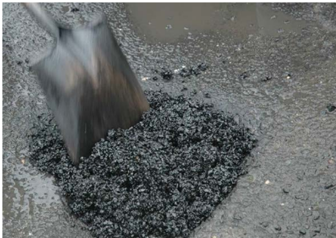
Hình B.3 – Hỗn hợp bê tông nhựa nguội phản ứng với nước ở mặt đường