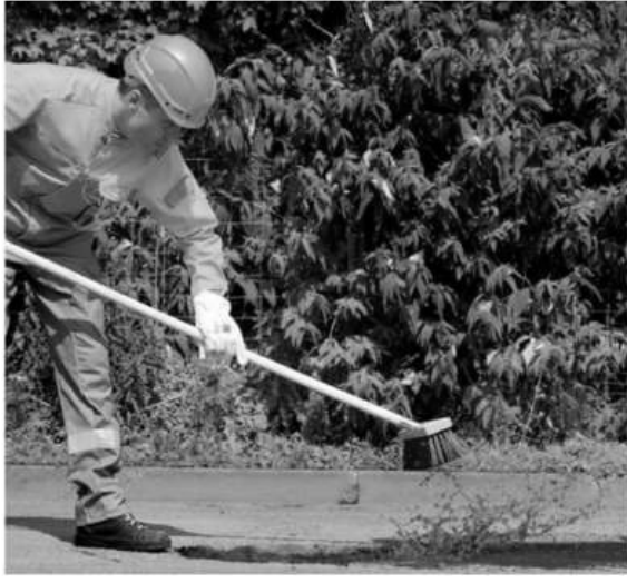
Hình B.1 – Chuẩn bị bề mặt trước khi thi công

Một số hình ảnh minh họa quá trình thi công và sửa ổ gà bằng hỗn hợp bê tông nhựa nguội phản ứng nước