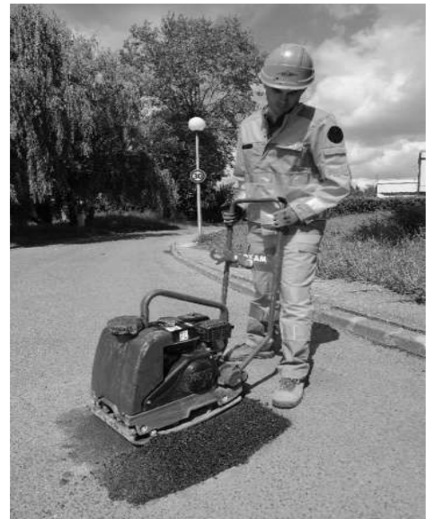
Hình B.6b – Đầm nén bằng đầm bàn