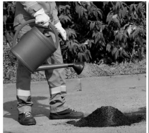
Hình B.4 – Tưới nước để hỗn hợp bê tông nhựa nguội phản ứng với nước